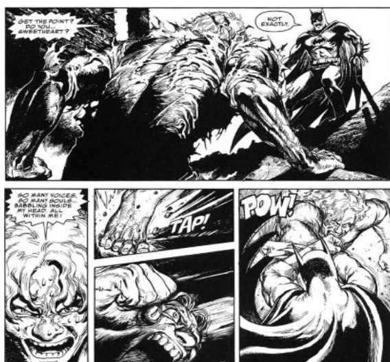
Fig. 4. Batman: The Third Mask by Katsuhiro Ôtomo (JP) in: Batman: Black and White #4 , DC Comics, USA, September 1996 (Verstappen, 2016).

Esta combinación de elementos añade una capa de misterio y profundidad al enfrentamiento, permitiendo una reflexión más profunda sobre la naturaleza del bien y del mal, así como sobre la capacidad de Batman para enfrentar adversidades que van más allá de lo convencional.