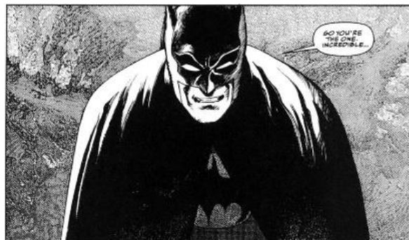
Fig. 2. Batman: The Third Mask by Katsuhiro Ōtomo (JP) in: Batman: Black and White #4, DC Comics, USA, September 1996 (Verstappen, 2016).

A través de la narrativa anterior, Ōtomo profundiza en los aspectos más complejos del personaje, explorando sus motivaciones y sus conflictos internos de una manera que desafía las convenciones tradicionales de los cómics de superhéroes. Analizar el estilo y la influencia de Ōtomo en la reinterpretación del personaje de Batman en "The Third Mask" es adentrarse en un fascinante cruce de culturas y estilos narrativos. Ōtomo, reconocido mundialmente por su obra maestra "Akira" 4 , aporta una visión única y fresca al universo de Batman, enriqueciendo el icónico personaje con una nueva profundidad y complejidad.