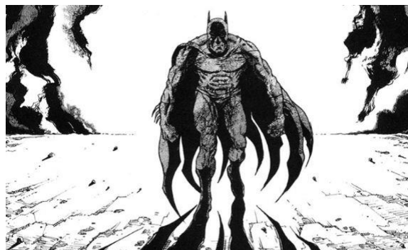
Fig. 5. Batman: The Third Mask by Katsuhiro Ôtomo (JP) in: Batman: Black and White #4 , DC Comics, USA, September 1996 (Verstappen, 2016).

Esta reinterpretación enriquece el universo del cómic, brindando a los lectores una perspectiva novedosa y multifacética del héroe, que combina la sombría elegancia de Ôtomo con la mitología establecida de Batman . La obra " The Third Mask " se convierte así en un puente entre dos mundos del cómic, mostrando cómo la colaboración intercultural puede generar narrativas poderosas y transformadoras. La visión de Ôtomo no solo respeta la esencia de Batman , sino que la expande, invitando a los lectores a descubrir nuevas facetas del personaje a través de una lente única y distintiva.