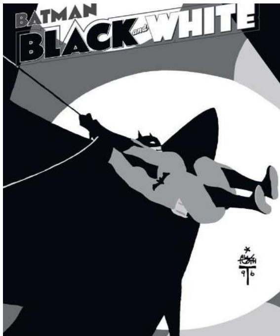
Fig. 1. Batman: Black and White vol.1 (Whakoom, 2024).

En 1996, DC Comics presentó la serie "Batman Black and White", dividida en tres volúmenes, cada uno con una colección de historias variadas realizadas por distintos artistas. En el primer volumen, que salió en septiembre de 1996, sobresale la participación de Katsuhiro Ōtomo, quien contribuyó con un breve trabajo de siete páginas titulado "The Third Mask" (Vongola, 2015).